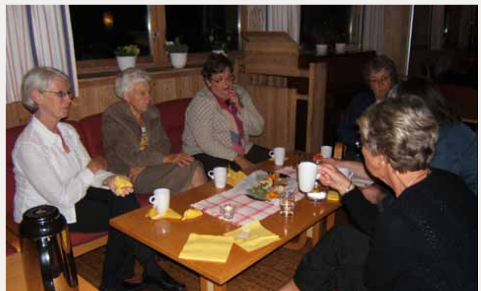
Alle generasjoner deltok. Når alle får uttale seg, får de også et større engasjement og eierforhold til planen. Trosopplæring angår ALLE!