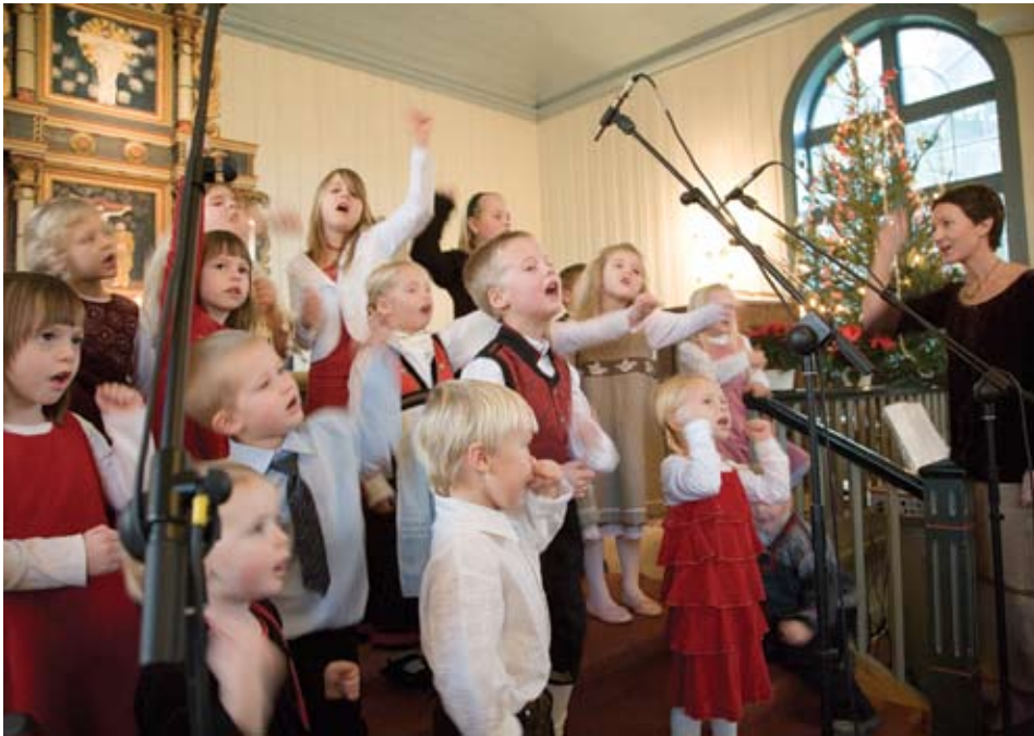
Knertekoret åpnet julaften 2006 med full trøkk. Sanglede og julegledde i skjønn forening.