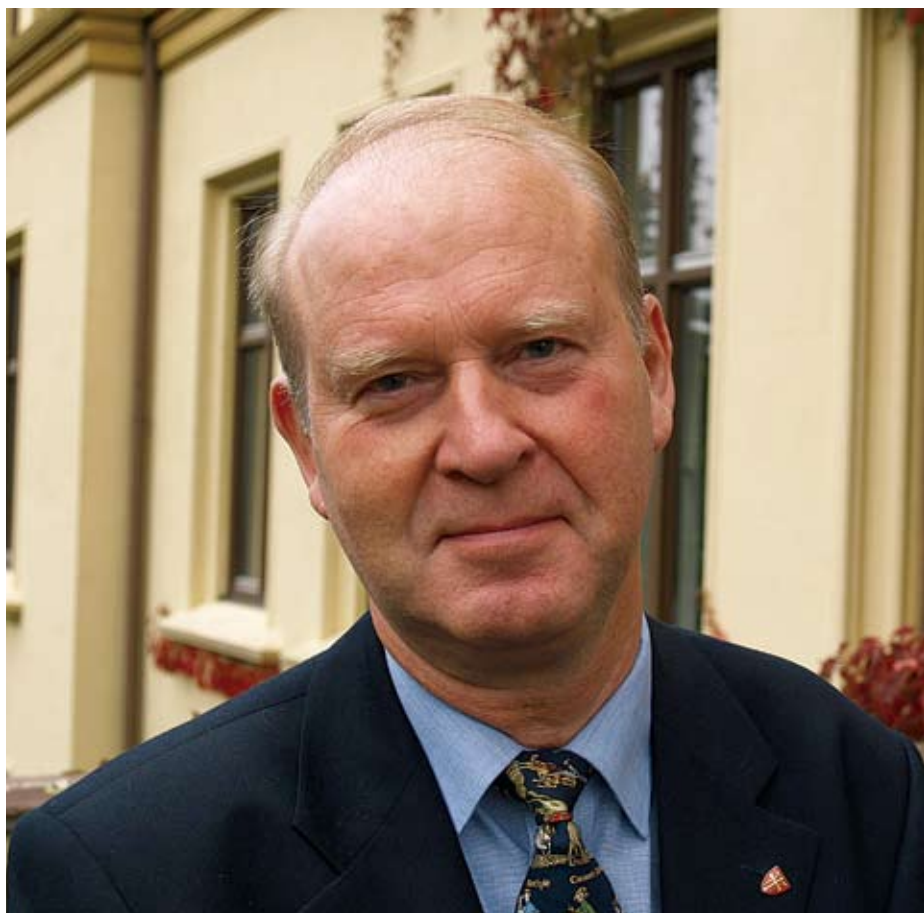
Biskop Olav Skjevesland besøker Søgne i midten av februar.