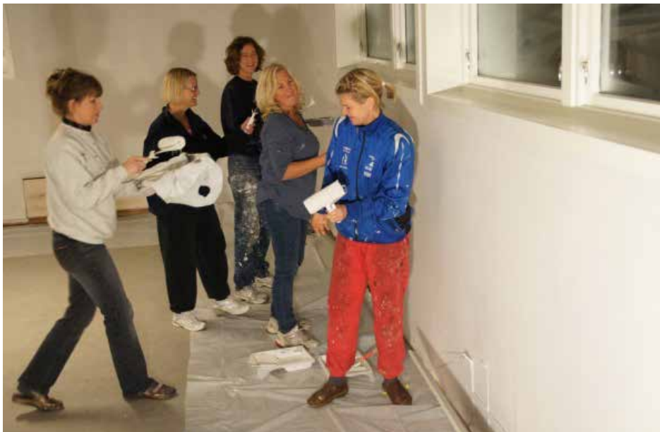
En jentegjeng tok initiativ til oppussing av matsalen.

Det har vært arbeidet lenge for å skaffe et sted å samlokalisere aktivitetene til Menighetshusforeningen og Bedehuset Betania. Da Agderstrand ble lagt ut for salg, opplevdes det som en gavepakke. Stedet ble kjøpt og fikk navnet «Søgne Menighetscenter».