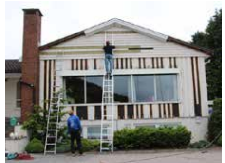
Dugnadsgjeng fikset opp Søgne Menighetscenter i sommer.