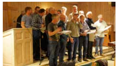
Noen av de tradisjonelle onsdagsmøtene er flyttet fra Betania til Søgne Menighetscenter. Vaglen. Her et møte hvor Søgne Kristelige Jaktlag deltok.

før jul stilte fire dugnadsfolk fra Menighetscenteret med biler og tilhengere og hentet 60 -70 flotte stoler. I tillegg fikk vi en del stilige ungdomsmøbler eller kafemøbler som det kalles. Dette blir moro å ta i bruk når ungdomsaktivitetene flytter fra Betania til Vaglen. Takk til BI og vår kontaktperson som gav oss en generøs gave.