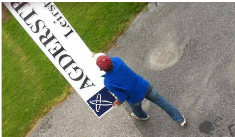
Det gamle «Agderstrand» skiltet er tatt ned, og styret ønsker et nytt skilt med ny logo.

Søgne Menighetsforening er en sammenslutning av tidligere Menighetshusforeningen og Bedehuset Betania. Søgne Menighetsforening eier for tiden 3 bygg. Et kondemnert menighetshus som står på Lunde og bedehuset Betania i Høllen. Det arbeides med å få solgt begge disse byggene. I tillegg eier foreningen tidligere Agderstrand på Vaglen. Dette er i ferd med å bli et felles senter for mye og variert kristent arbeid i bygda. Fremtidsmålet er å bygge et nytt funksjonelt bygg på Vaglen og samle all aktivitet fra Menighetshuset og Betania i dette bygget. I tillegg er det et håp at det blir startet nye tilbud. Nå ønsker Menighetsforeningen en logo som kan prege bygget på Vaglen og som kan brukes i annonser.