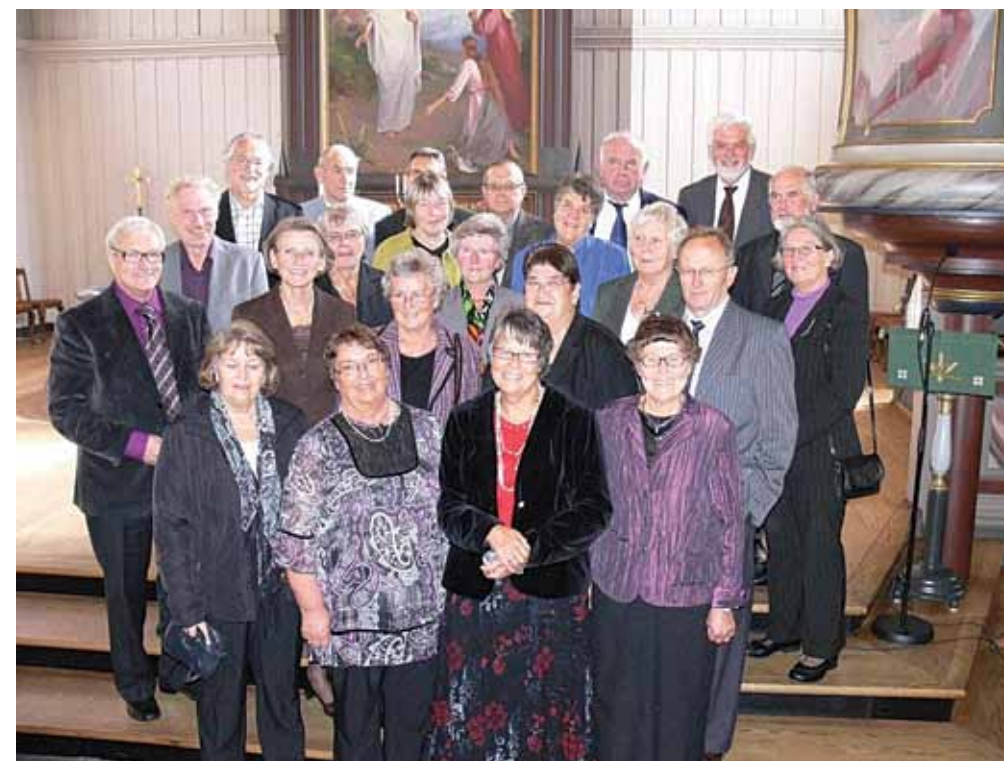
Gullkonfirmanter i Søgne 2009.