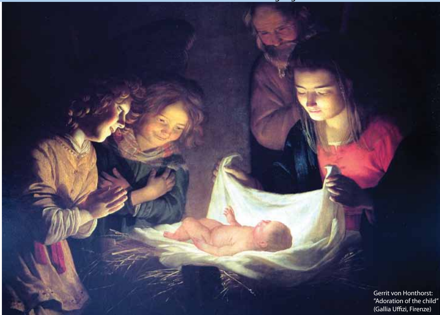
Gerrit von Honthorst: "Adoration of the child" (Gallia Uffizi, Firenze)