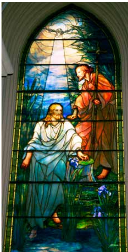
Jesus døpes av Johannes i Jordan.

Vi nærmer oss sankthans. Når vi ser bort fra de store høytidene, er vel dette den eneste av de gamle merkedagene våre som fortsatt feires av en stor del av befolkningen. Men opprinnelsen er stort sett gått i glemmeboken.