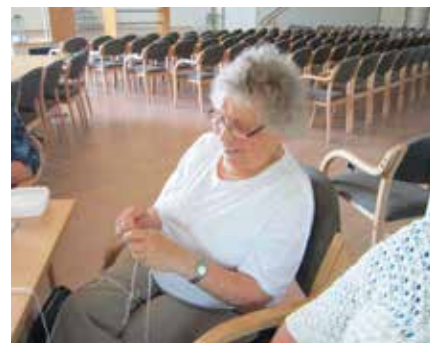
Det hender fortsatt at strikketøyet kommer frem på møtene.